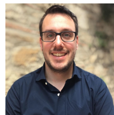
Alzheimer Centrum Radboudumc